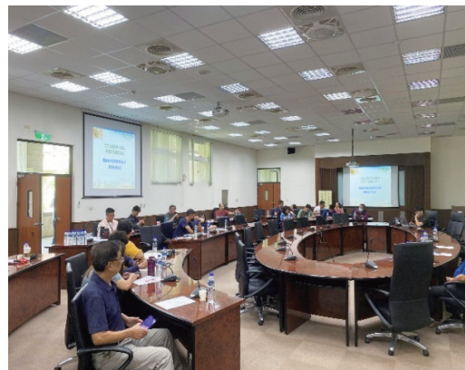
圖3. 農業水資源研究群於2025年4月16日假高雄旗山毛豆需水量驗證場域召開產業應用觀摩交流會(左), 本場在7月18日辦理「毛豆生育期需水量及最適灌溉模式」講習會1場(右), 計有專業豆農45人參加, 提供專業豆農最適灌水指引。