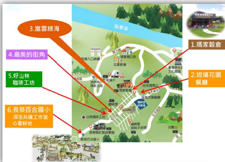
圖 2. 瑪家鄉禮那里部落瑪家村農業遊程位置圖