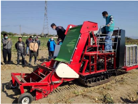
田間採收作業情形

為因應政府省工省力產業機械化政策，舒緩洋蔥產業勞動力短缺、老年化問題，因此開發符合洋蔥產業之收穫機械。其功能包含採收、篩選(二次篩選)、剪莖葉、輸送至收集籃(太空包)，藉以節省農民採收作業之時間與勞力成本，提升作業效率。今年度研發之行走動力部(載具)係為獨立單元，以履帶式底盤改良，其機構採全油壓驅動之無段變速，旋轉半徑小，適合於小面積田區作業及符合洋蔥種植型態。目前已完成雛型機，測試各機構性能及耐久性。