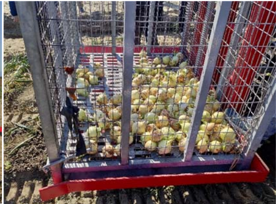
採收後洋蔥球情形