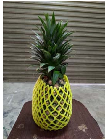
機械網袋包裝情形