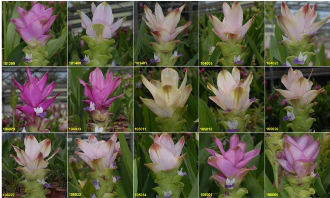
圖 1. 2020 年度選拔之薑荷花優良品系

優良新品系選拔：薑荷花新品系 KCUR101373、KCUR101387，以清邁粉品種為對照品種，完成性狀調查，將提出品種權申請。另由 2020 年度已開花之雜交後代植株中選拔 KCUR101399、101400、101401、104005、104022、104029、104033、105011、105012、105026、105027、105032、105034、106001、106005 等 15 個單株(圖 1)，持續進行後續評估。2021 年度由其中選拔性狀優異之 KCUR104029、105027 等 2 個品系(圖 2)，切取芽點進行組織培養建立種苗繁殖體系，供做下年度後續評估及性狀調查作業。