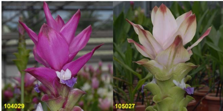
圖 2. 選拔薑荷花優良雜交後代單株