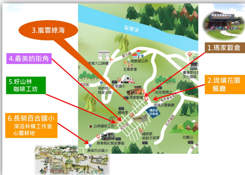
圖 2: 瑪家鄉禮那里部落瑪家村農業遊程位置圖