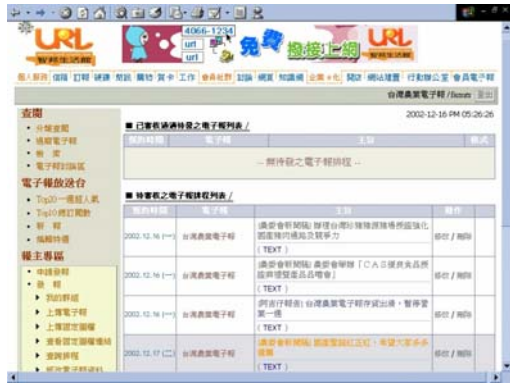
圖 3、智邦電子報部分管理畫面