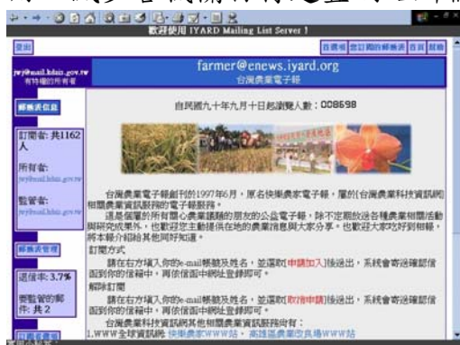
圖 1、台灣農業電子報介紹畫面

系統建置完成後，目前已將原本透過中山大學網路主機提供的服務完全遷回本場主機自行放送，未來除繼續提供各種在地的農業資訊外，並將提供轄區內其他有意提供電子報放送服務的農業機關團體免費使用，減少各機關自行建置網站所需的人力物力，提供更便利的服務。