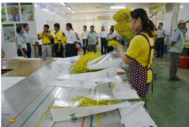
王副主委參觀文心蘭外銷包裝場