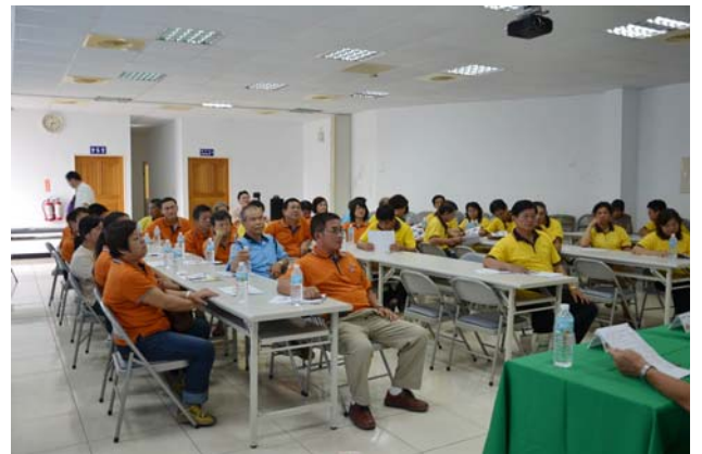
文心蘭產銷班班員專注座談會的神情