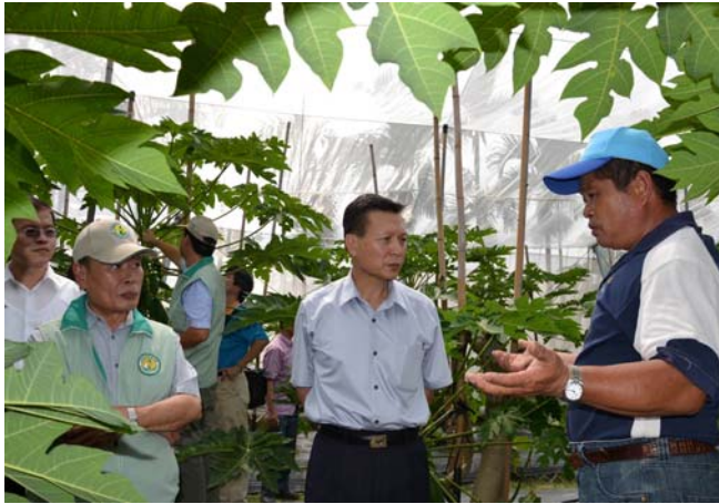
王副主委(中)聽取楊班長說明目前木瓜外銷情形