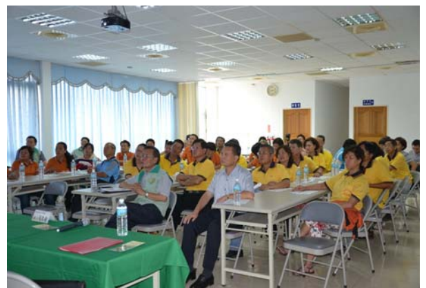
王副主委聽取文心蘭產銷班簡報