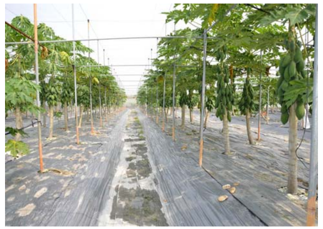
維持良好的田間衛生，可降低病蟲害滋生