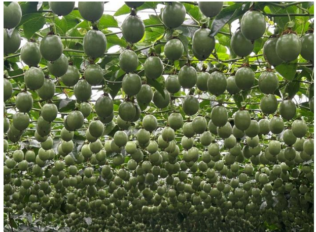
百香果利用蜂箱啟閉結構控制蜜蜂打卡上班之著果情形，媲美人工授粉