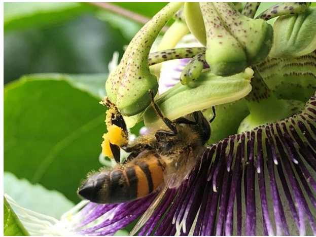
百香果花朵柱頭下彎時，是最佳授粉時機