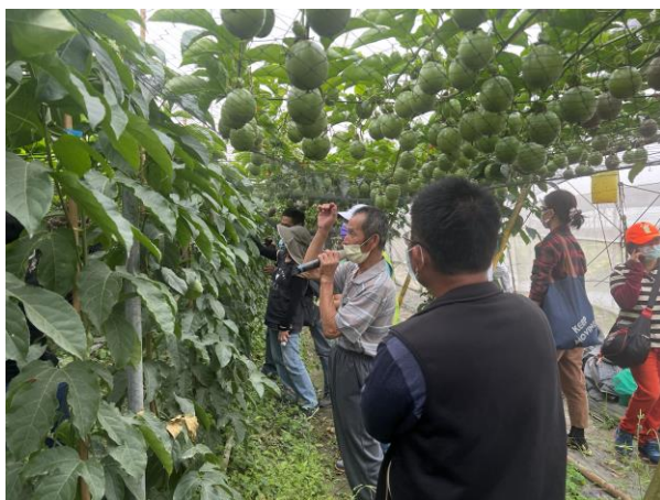
鍾清泰農友分享田間實務栽培心得