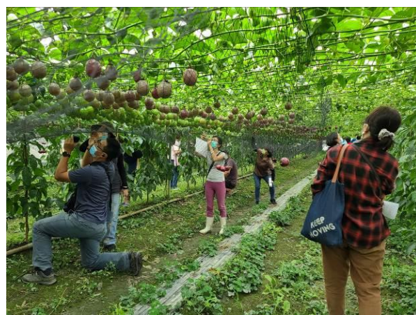
參觀結實纍纍的百香果園區