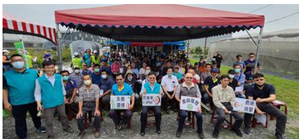
農友嘉賓熱烈參與，見證安全無毒果香果