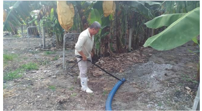
農民於香蕉果園澆灌稀釋畜牧發酵沼液情形