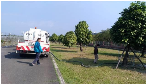
槽車直接將沼液澆灌景觀植栽還肥於田