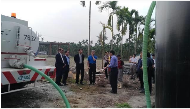
槽車運送沼液存於暫存桶可於灌溉時稀釋使用