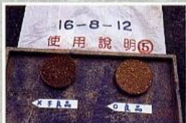
供給機械施用肥料良劣品之區分