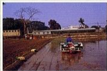
六行式深施機田間作業情形