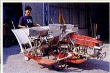
六行式水稻插秧兼深層施肥機側照