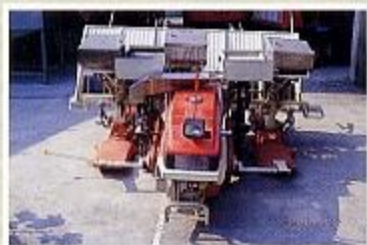
六行式水稻插秧兼深層施肥機前照