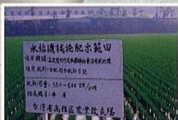
水稻深施示範田水稻生長整齊劃一