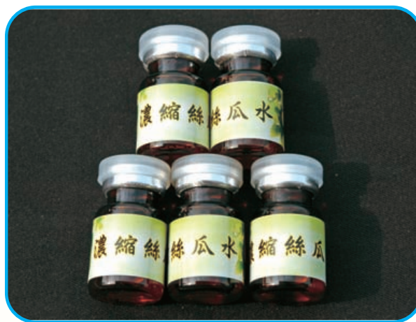
圖18. 絲瓜水是生態美容保養聖品