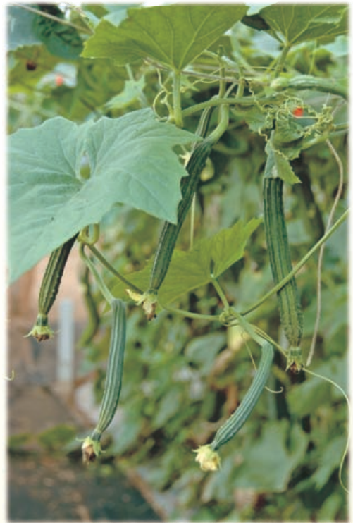
圖1. 父本8402品系具有多雌花特性

綜合96年春、秋二期作的區域試驗結果顯示，以雜交新品系KPHC93-38品系表現最優，具有發展潛力，於是提出申請品種命名登記。97年審議通過，品種名稱為絲瓜澎湖1號，商業名稱為愛稜。本品種是雜交新品系第一代，父本具有多雌花(圖1)、果實自然筆