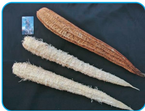
圖17. 絲瓜絡是天然的清潔用品