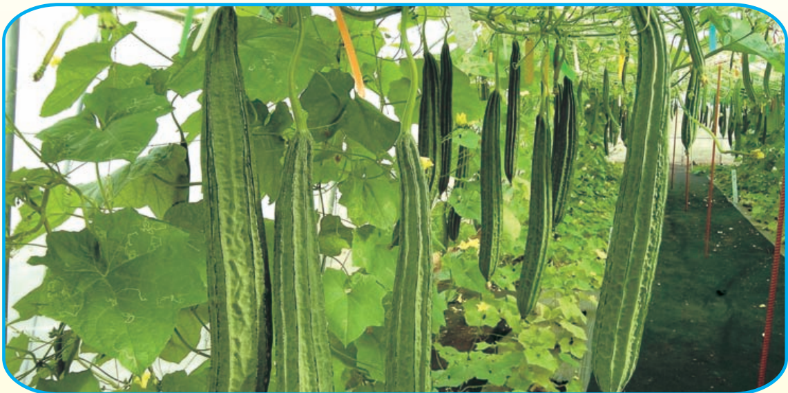
圖10. 澎湖 1 號具有節成性佳的特性