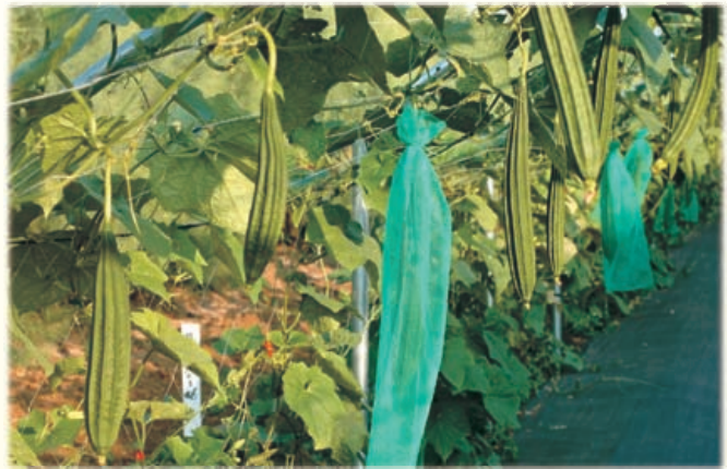
圖16. 露地栽培採果實套袋，可以防治瓜實蠅危害。