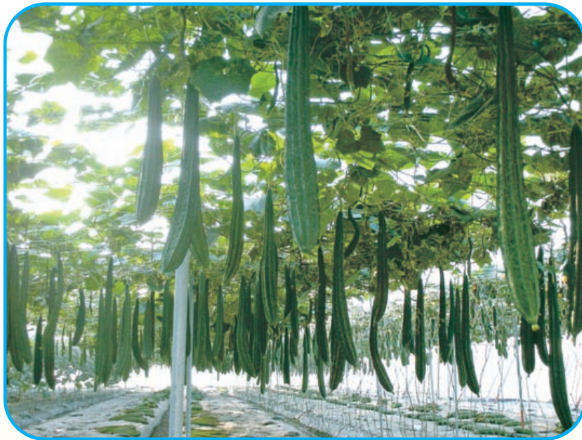
圖11. 澎湖 1 號在2010國際種苗節試種結果纍纍