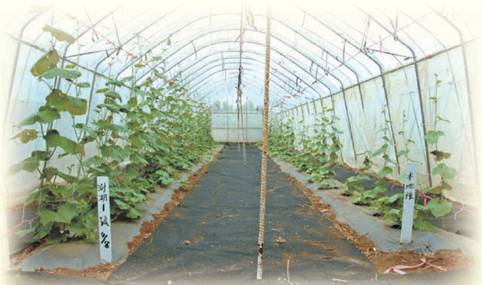
圖7. 簡易設施內栽培，澎湖 1 號生長速度(左)優於澎湖種(右)。