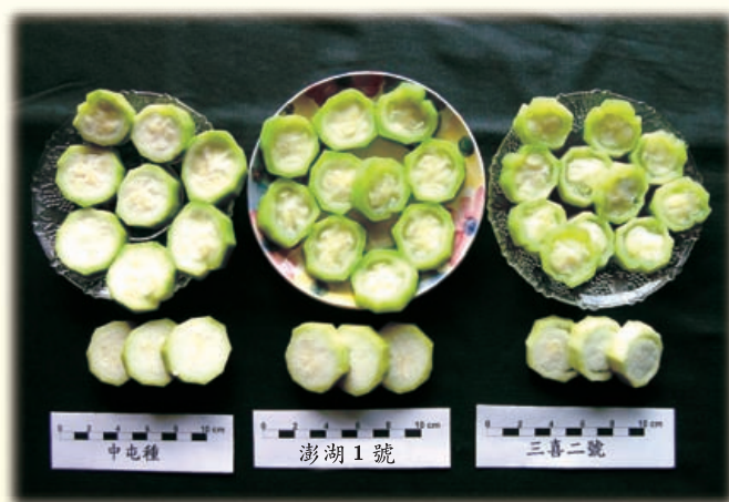
圖12. 澎湖 1 號(中)蒸煮後，果肉不易褐變，口感甜脆。