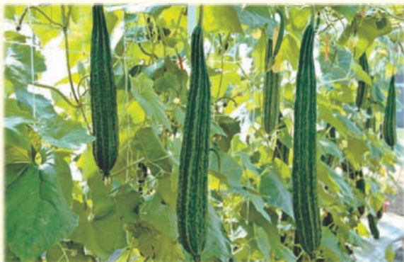
圖2. 父本8402品系果實自然筆直，果長40-50公分。