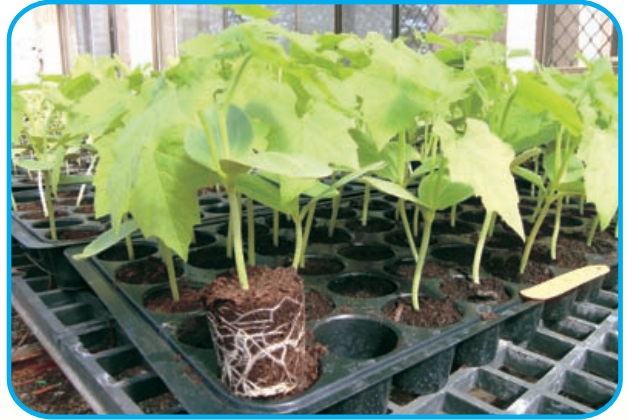
圖13. 優良稜角絲瓜穴盤苗

澎湖地區春作適合2~3月播種，採露地棚架或利用咾咕石牆栽培(圖14)，秋作適合9月~隔年1月播種。因為澎湖地區秋冬季有東北季節風影響，一般露地無法栽培，需在簡易設施內種植。本品種尤其適合秋作9月，利用簡易設施來栽培，生長勢強，栽培容易，早生，節成性佳，雌花發生多，產量高且品質好。每公頃約可種植6,000~8,000株。