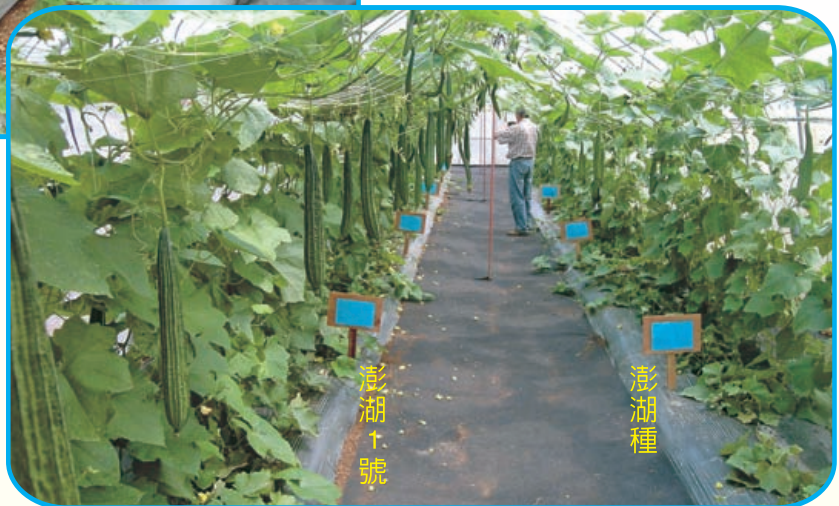
圖9. 澎湖 1 號(左)結果比澎湖種(右)早，具有早生的特性。