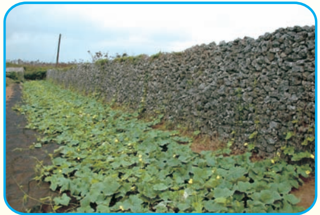
圖14. 利用咾咕石牆防風栽培，效果不錯。