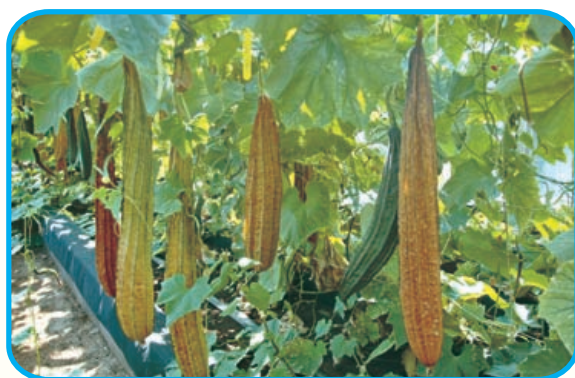
圖4. 澎湖 1 號品種果莢生長情形

直、中果型(果長介於40~50公分)的特性(圖2)；母本則具有早生、節成性佳及豐產的特性(圖3)，雜交後很容易獲得種莢(圖4)及種子(圖5)。