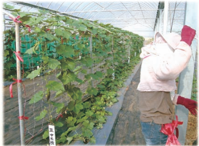
圖15. 稜角絲瓜採搭架栽培，管理與採收都方便。

不論露地或設施內栽培，建議採用拱型架或棚架栽培(圖15)，避免地面匍伏式栽培，以免果實彎曲。瓜蔓上棚架前，進行母蔓摘心，促進子蔓產生。同時將子蔓平均分佈在水平架上，避免葉片重疊，有益結果與減少病蟲害的發生。露地栽培時，果實易受瓜實蠅危害，在授粉結果後，最好進行果實套袋(圖16)。病蟲害防治請參考植物保護手冊施用農藥，一定要避免農藥殘留。