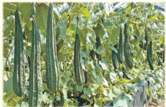
圖3. 母本8404品系具有早生、節成性佳及豐產的特性。