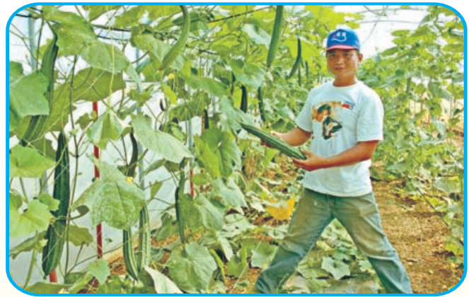
圖6. 澎湖 1 號在澎湖縣湖西鄉大城北蔬菜產銷班簡易設施內試種情形

民國98年，分別於澎湖縣湖西鄉大城北蔬菜產銷班(圖6)及白沙鄉後寮蔬菜產銷班二處，進行稜角絲瓜新品種栽培示範。結果顯示，澎湖1號具有生長勢強特性，明顯比澎湖種生長快速(圖7)、結果節位低(圖8)、早生(圖9)、節成性佳(圖10)的特性。另外，2010年國際種苗節，由技轉廠商「欣樺種苗公司」提供給大會於高雄市花卉公司農場試種。結果顯示，澎湖1號(愛稜)具有豐產(圖11)的特性。