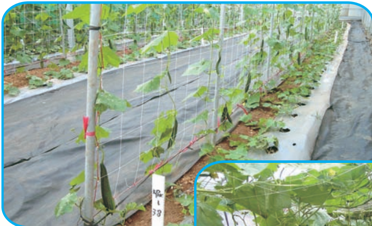
圖8. 澎湖 1 號 (KPHC38) 具有結果節位低的特性