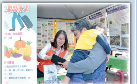
防檢局高雄分局也來參展，推廣動植物檢疫防疫業務。