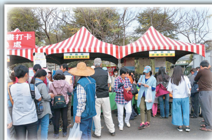
屏東林管處配合本場活動，以發票換樹苗，大家一起維護地球生態。