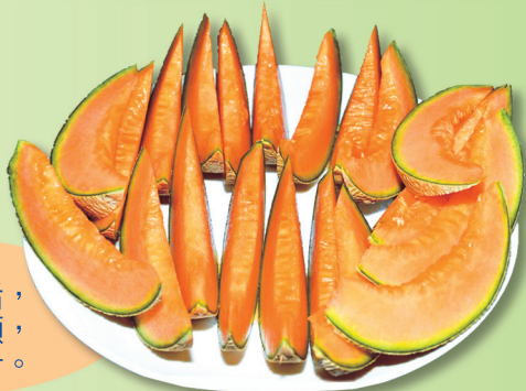
洋香瓜高雄2號—橘后， 肉色橙紅，網紋明顯， 果肉香Q多汁。

本品種已與王怡雯小姐(0911-923164)及農友種苗公司簽署非專屬授權，有意願栽種者可逕洽購買種子等相關事宜；也歡迎種苗業者、農會、產銷班、合作社或個人，與本場接洽品種非專屬授權事宜。