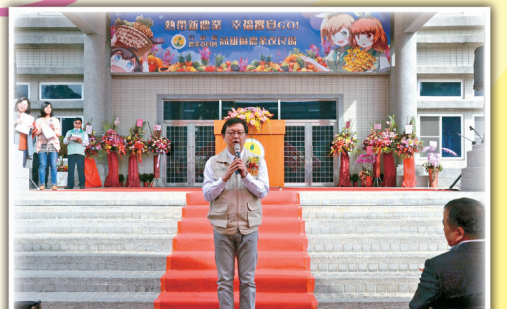
李副主委勉勵並致賀詞

本場今年迎賓日節目豐富，除扣合新農業研發成果展示及地區優質農特產品展售區吸引民眾駐足採購外，農業創意活動、景觀花卉及熱帶花卉花藝區都吸引源源不斷的人潮，熱鬧非凡；其中青農專區則是完全由青農自動自發策畫的「青農上菜~春饗野宴」活動，使用青農生產的安全優質農產品製成餐點，以預約取餐的方式在本場大草原進行野餐，更是以實際行動鼓勵青年從農的一大亮點~~今年本場迎賓日圓滿成功、鬧熱滾滾！