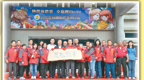
張處長與十大績優產銷班燕巢區農會果樹產銷班第12班合影