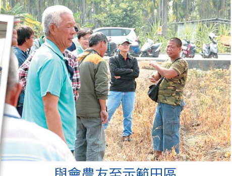
與會農友至示範田區 觀看巴拉刈代噴成效