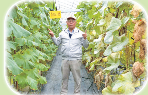
洋香瓜高雄2號—橘后(左)具極抗白粉病 特性，種植期間減少用藥20~30%，與 同一溫室對照品種比較，表現優良。