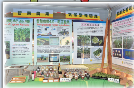
本場扣合新農業研發成果展示