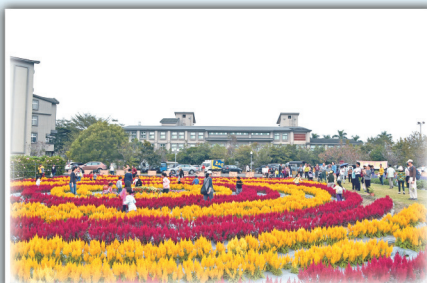
景觀花卉區吸引駐足的人潮，小朋友在羽狀雞冠花迷宮中快樂奔跑。