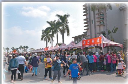
優質農特產品展示區人潮不斷