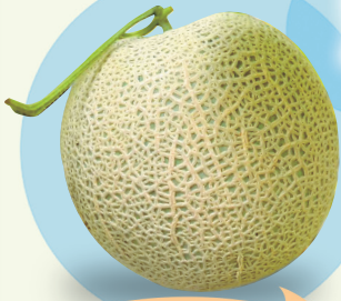
高雄2號—橘后 果實外觀漂亮吸睛

本場於105年推出抗白粉病的優質洋香瓜新品種高雄2號—橘后之後，即積極進行非專屬授權業界利用及加強地方試作工作，以加速新品種的推廣及產業運用，並輔導生產安全、優質溫室洋香瓜。繼106年秋作嘉義縣太保市青農展現橘后品種風華之後，藉屏東縣冬季得天獨厚的氣候，長治鄉青農生產的果實不論網紋、果型及食味品質皆屬上品，預計元月中旬至下旬上市。