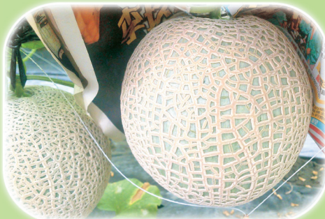
青農利用果實套袋技術，可增加洋香瓜 高雄2號—橘后果實外觀質感。