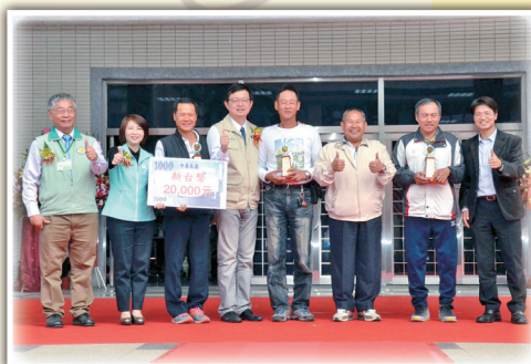
李副主委與蜜棗特等獎得主合影