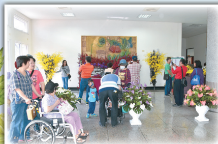
熱帶花卉花藝區展示吸引來賓欣賞、拍照。