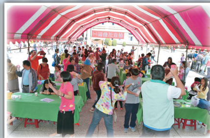
創意活動—大人小孩一起來用力搖一搖，紫紅冰淇淋馬上就做好。