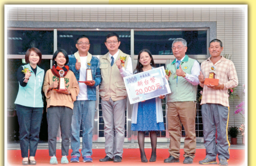
李副主委與蓮霧特等獎得主及輔導單位合影