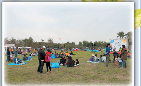
「青農上菜~春饗野宴」野餐系列活動吸引滿滿人潮