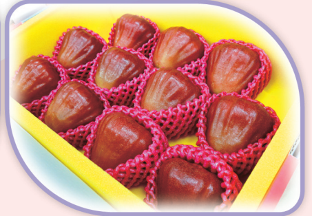
蓮霧特等獎參賽果品，果型勻稱無瑕疵、色澤深紅、口感一級棒。