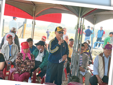
現場農友反映熱烈，提出 許多實務上遭遇的問題。