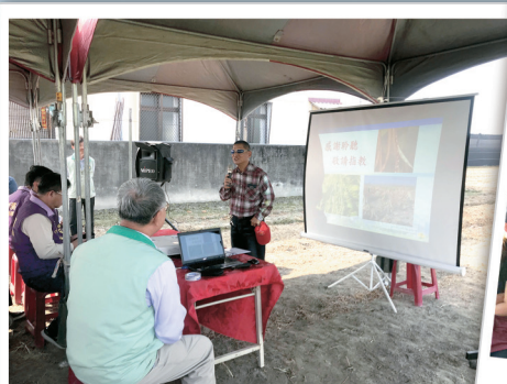
會議中，萬丹鄉林山農友針對 本計畫的執行進行心得分享。