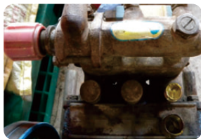
圖6. 噴霧機的牛油杯位置