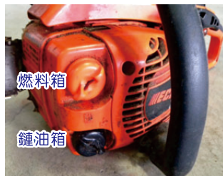
圖9. 燃料箱與鏈油箱的位置