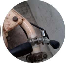
圖3. 加油座推桿用來 控制引擎轉速