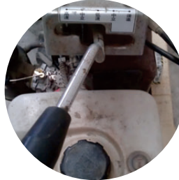
圖2. 變速桿用來控制 刀具轉速