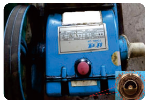
圖5. 檢查曲軸箱的機油量是否正常