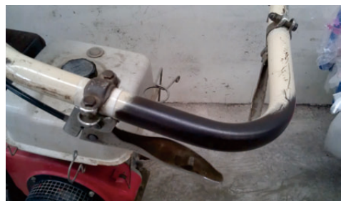
圖4. 中耕機之轉向離合器把手