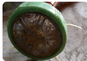
圖8. 注意吸水管的清潔