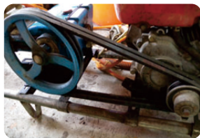
圖7. 噴霧機的三角皮帶鬆緊度