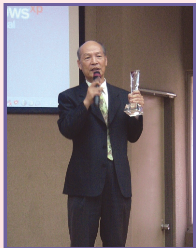
黃場長受獎後發表感言