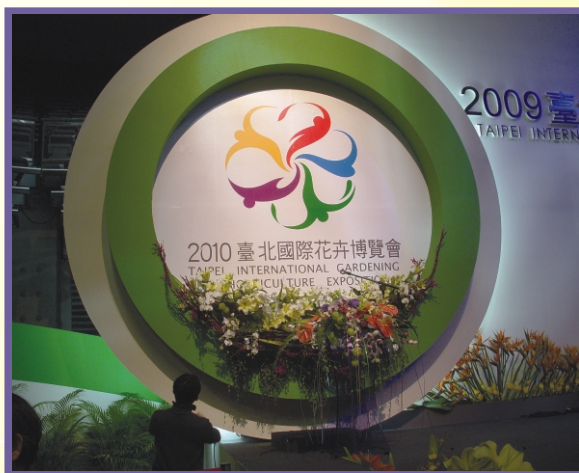
2010年臺北國際花卉博覽會LOGO

台灣花卉近年來在世界各地逐漸展露頭角，蝴蝶蘭更被喻為台灣最具有競爭力之花卉產業，其他例如：文心蘭、火鶴花、洋桔梗為重要外銷切花，尤其目前文心蘭及火鶴花在日本市場的佔有率分別為91%及84%，為「絕對市場佔有」之花卉產業。未來希望藉由舉辦大型的國際性花卉展，讓台灣的花卉有機會能名揚海外，帶動花卉產業更蓬勃發展。