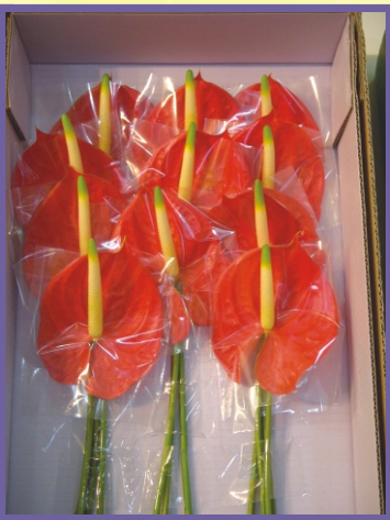
轄區花農展示外銷火鶴切花