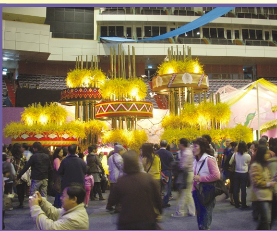
主題形象區-花舞原鄉