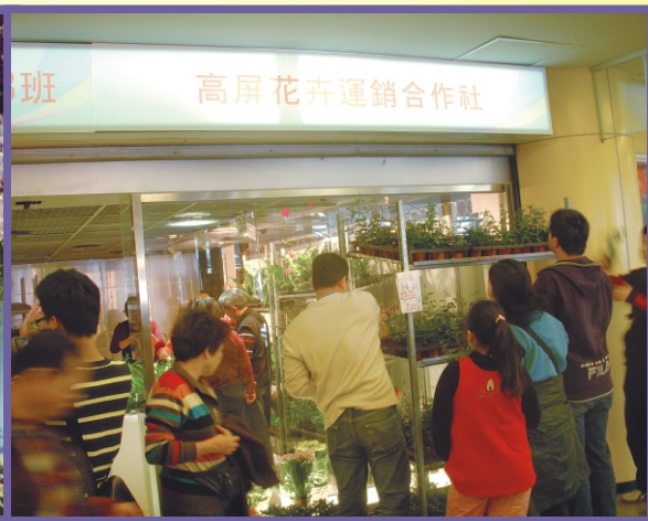
轄區花農至展場銷售盆花