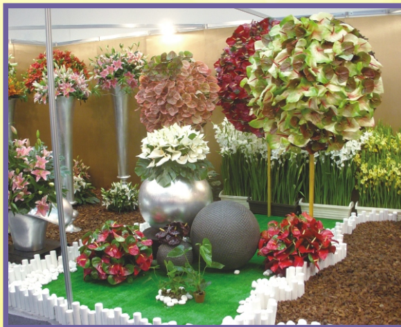
國內外企業區-荷蘭館