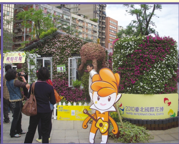
戶外意象區-鳳仙花屋