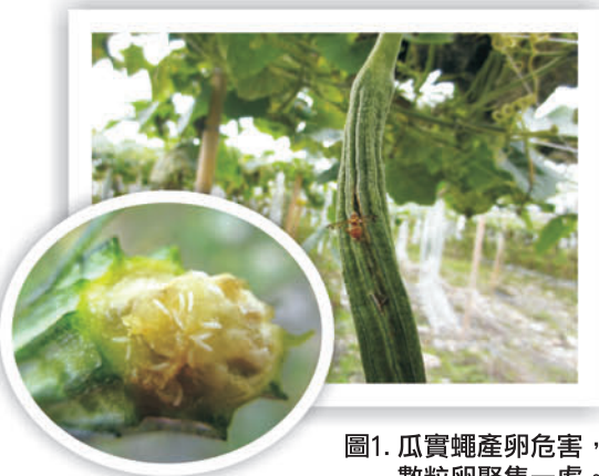
圖1. 瓜實蠅產卵危害，數粒卵聚集一處。

瓜實蠅 ( Bactrocera cucurbitae ) 是瓜類作物的頭號公敵，農友俗稱為「蜂仔」或「瓜仔蜂」。由於臺灣氣候條件適宜各種瓜果類的生長，且各瓜果成熟期不一致，加上雌蠅繁殖能力強，以致瓜實蠅全年有寄主植物提供充足食物而成為瓜果類蔬菜重要害蟲。雌成蟲通常於雌花授粉後即會前來產卵在膨大的子房上，通常數粒卵成堆產於一處(圖1)。受害的絲瓜、小黃瓜及扁蒲的幼果表皮會有流膠現象。幼蟲孵化後，於瓜肉中蛀食，導致果實畸形或腐爛，嚴重影響瓜果的收成量及其商品價值。瓜實蠅成蟲飛行力很強，但通常只在需要取食或產卵時才會飛進瓜園內，其餘