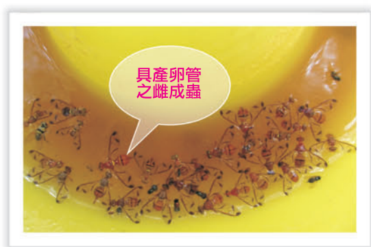
圖3. 酵母錠誘殺器內所誘殺的瓜實蠅

外圍雜草或樹木蔭涼處分別懸掛15組合酵母錠及克蠅香的誘殺器，每週監測調查被誘殺的蟲數。由圖4可看出隨溫度的升高及稜角絲瓜的成長(4/20開始開花)，瓜實蠅被誘捕的數量也隨之增加，至5月中旬達到最高峰。由試驗結果可知，雖然添加酵母錠的誘殺器所誘殺的蟲數較克蠅香所誘得蟲數少，但其誘殺的瓜實蠅雌雄數量比約1.8：1，以雌成蟲居多(圖5)，因此可較有效減少雌蟲產卵的數量，而得到較佳的防治效果。