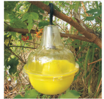
圖2. 蔭涼處懸掛酵母錠誘殺器

酵母錠在許多國家已被應用做為瓜實蠅密度監測專用材料。使用時，於誘殺器中加入2顆酵母錠及7~8分滿的水，不須添加農藥，吊掛於瓜