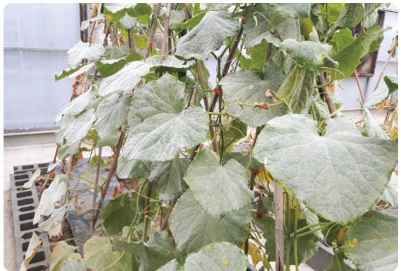
圖1. 溫室栽培小胡瓜白粉病常嚴重發生

應用溫室等設施栽培，因可隔絕雨水及部分昆蟲，病蟲害種類相對較少，但部分病蟲害如白粉病及小型害蟲仍常發生在設施栽培的小胡瓜，且設施內相對隔離的環境因缺乏競爭，病蟲害入侵時常迅速擴散，故病蟲害管理上首重種植前的清園消毒，並於栽培過程避免外來病蟲害，以利設施栽培發揮成效。本場106~107年4場次試驗調查，病害以白粉病最為普遍發生，尤以秋作發生較嚴重，對照組的罹病率甚至可達100%(圖1)，此與設施內通風較差，而白粉病好發於冷涼乾燥且通風不良的環境有關，此外亦有露菌病、褐斑病及根瘤線蟲等