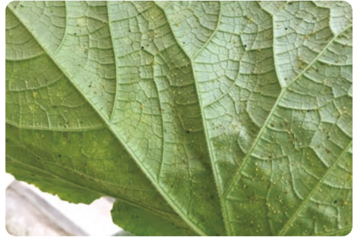
圖2. 蚜蟲等小型害蟲為溫室小胡瓜常見害蟲

星發生。設施內害蟲以粉蝨、薊馬及蚜蟲等小型害蟲為主(圖2)，發生種類則較無規律，推測外來害蟲為主要來源，106年秋作幾乎無蟲害發生；107年秋作則有粉蝨、薊馬及蚜蟲發生，且蚜蟲危害情形嚴重，而春作及夏作，粉蝨及薊馬等害蟲發生情形較秋作嚴重，尤以粉蝨發生為甚，應與栽培期溫度較高有關。