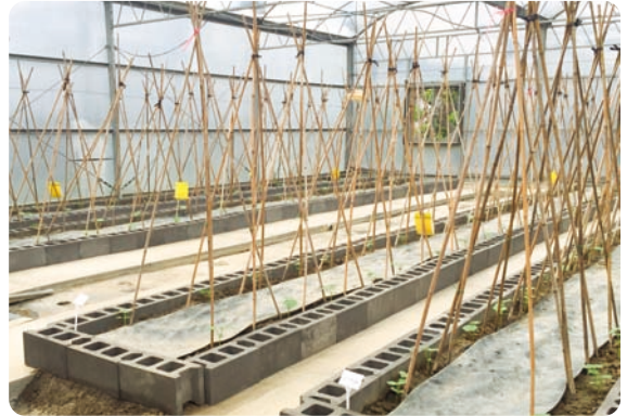
圖3. 應用黃色黏板除可防治粉蝨及薊馬等害蟲亦可掌握害蟲密度

107年各期別皆有粉蝨危害情形，另有薊馬及蚜蟲危害，粉蝨與薊馬透過黃色黏板進行防治並掌握族群密度(圖3)，蚜蟲則於每週調查植株葉背掌握發生情形，於害蟲發生初期即開始施藥防治，施藥後一週調查害蟲族群，並換算防治率。化學藥劑優先選擇可兼