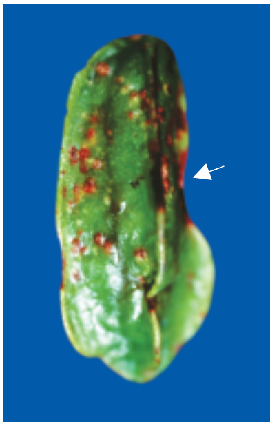
▲圖三、受害果實造成畸形果，病斑亦發生於稜角部位（箭頭處）

於嚴重時呈現壞疽斑（圖二）；果實罹病初期產生紫褐色大小不一之凹陷病斑，病斑周圍亦呈現黃色暈環，幼果被感染則易造成果實畸形（圖三），嚴重時落果。