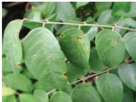
▲圖一、楊桃葉片受害，呈現紅棕色病斑，並於病斑外圍形成黃色暈環

本病全年皆可發生，為病原細菌 P. syringae 所引起，罹病之葉片、枝條及果實為主要感染源，可經由氣孔及傷口侵入感染。該病原菌可危害楊桃葉片、枝條及果實，受害葉片初期產生針點狀之深綠色水浸狀病斑，並逐漸擴大為直徑 2-3 公釐的圓形病斑，此時病斑呈現紅色，並於病斑外圍形成黃色暈環（圖一），嚴重時葉片黃化並提前落葉；枝條罹病初期顯現紅褐色凸起斑點，隨後病斑拉長呈橢圓形並