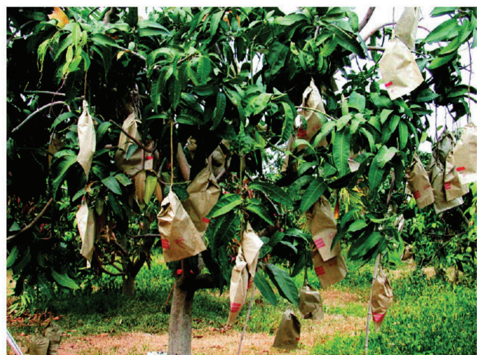
▲套上標有紅線的黑色牛皮紙袋當作採收指標

‘金煌’芒果謝花後30-40日，果實約拇指大小，將無子果、畸形果、罹病果提早淘汰，能促進著果，亦可提高果實品質及加速成熟；疏果後配合套袋，能降低東方果實蠅、果斑病、炭疽病及蒂腐病危害，減少噴藥次數，降低農藥殘留的風險，促使果實外皮細緻光滑。套袋前先作病蟲害防治，然後再套上黑色牛皮紙袋，封口需確實密封，以防止雨水自袋口沿果梗流入袋內。