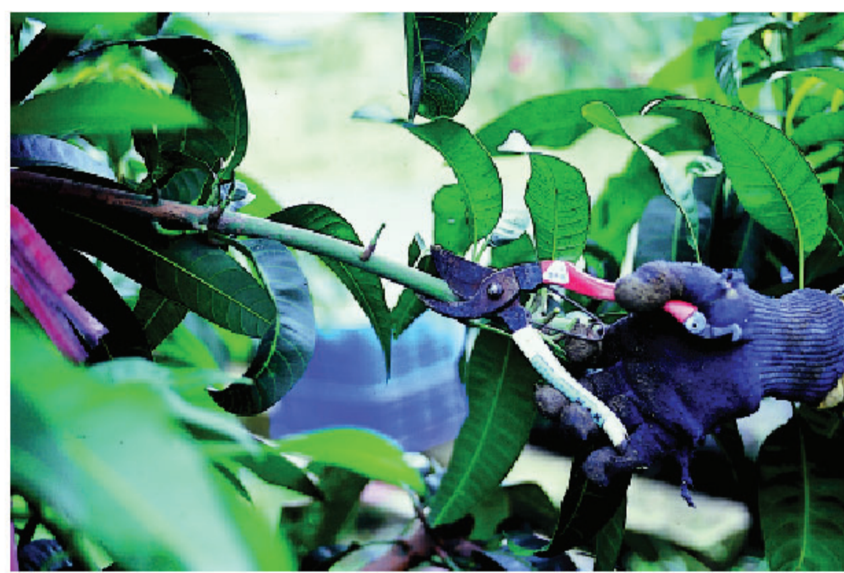
▲果實採收後，枝條回剪1-2次枝梢

‘金煌’芒果生長勢強，易造成植株徒長、枝條雜亂過密、日照不足、通風差，影響管理作業，病害發生較嚴重，使得開花少、著果低。因此，應砍除過密或矮化高大的植株，樹體每年也需做適度的修剪。一般在果實採收完畢，將結果枝回剪1至2次枝梢，切口不要在『節』上，避免長出過多的新梢，長出的枝梢若直立，可作水平式誘引。秋末冬初，疏剪過密的枝條，保持樹冠日照充足及通風，以培育健全的結果母枝，在翌年疏果時，將未開花、著果或罹病枝條剪除，但不宜過度修剪，需讓果實稍微遮蔭，將可使表皮較為美觀。