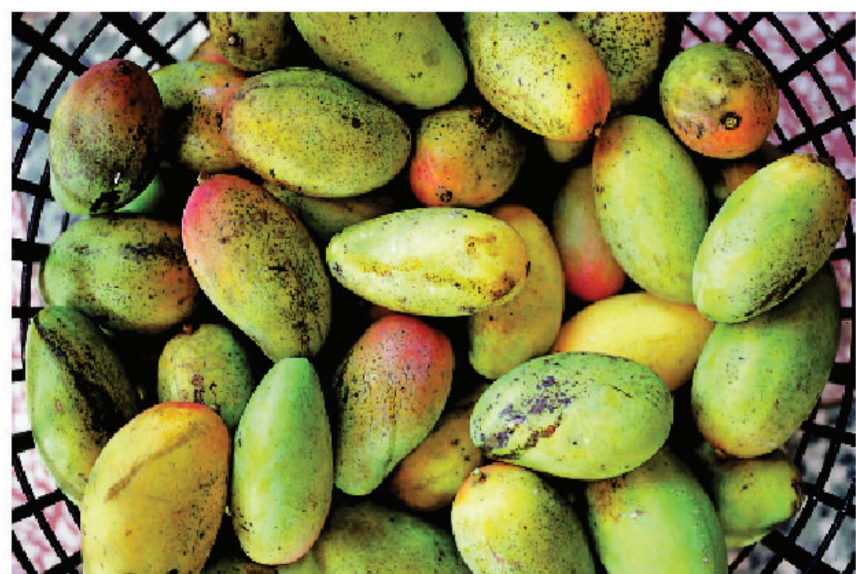
▲授粉受精不良的珠仔果