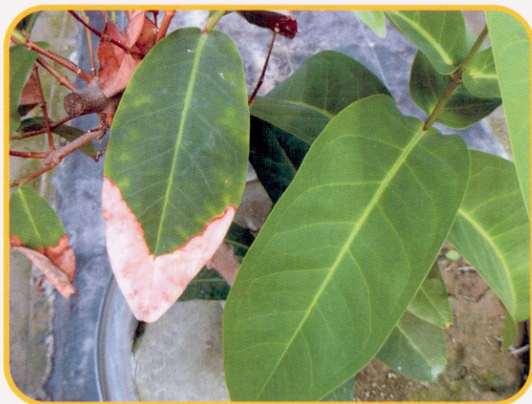
▲ 圖2. 缺鉀時，於成熟葉之葉緣及葉尖出現白、黃或橘色之點或條紋，繼而發生褐變或壞死。