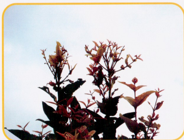
▲ 圖6. 蓮霧缺鋅造成節間縮短而呈小葉簇生狀。