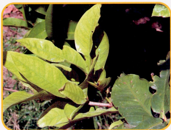
▲ 圖4. 蓮霧缺錳時，嫩葉之葉脈呈綠色細網狀，而葉脈間綠色漸消退，此時葉片錳含量僅10~15ppm。