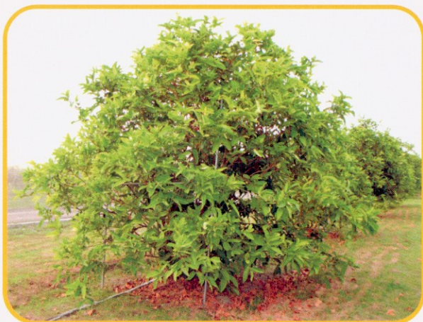
▲ 圖1. 蓮霧氮素缺乏時易使葉片黃化，左圖為氮素充足植株，右圖為氮素缺乏植株。