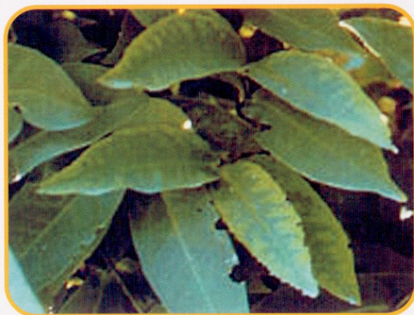
▲ 圖7. 農民於催花藥液中添加尿素，行葉面噴施所造成。葉片之葉緣部分葉脈間淡黃，而中肋和葉脈仍維持正常之綠色。 (摘自作物營養障礙圖鑑)