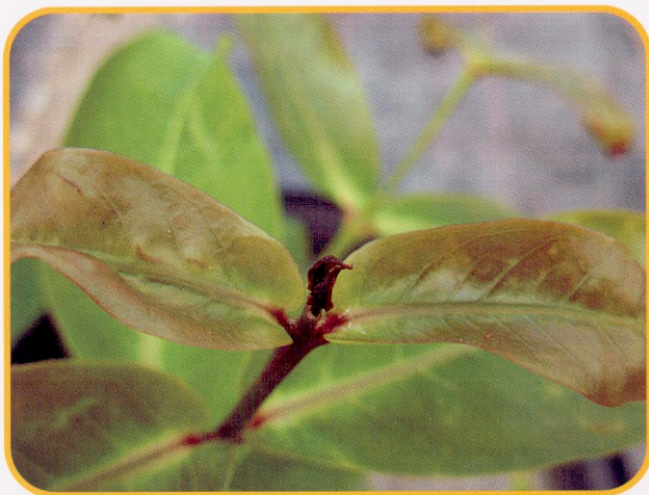
▲ 圖5. 蓮霧缺硼時易使生長點壞死