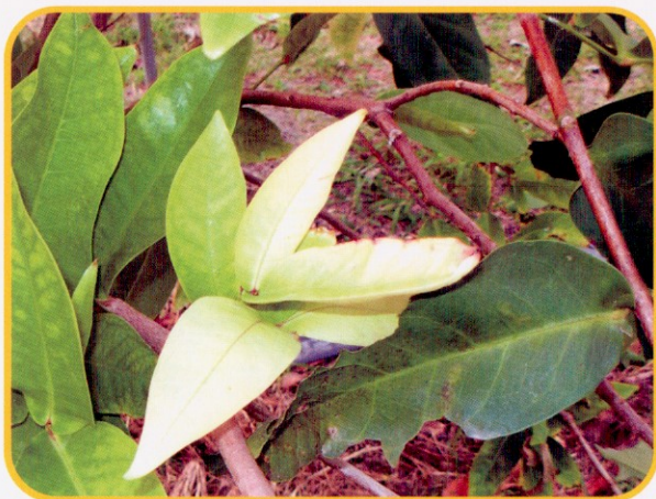
▲ 圖3. 蓮霧缺鐵時會自新葉長出不久後黃化，嚴重時甚至白化。