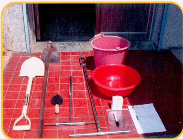
◀ 圖8. 蓮霧園土壤採樣工具（左至右，圓鏟、鋤頭、移植鏟、土管、土鑽；右上至下，水桶、水盆、採樣盒、紙袋、油性筆、筆、記錄紙）。

採樣工具一般有土管、土鑽、土鏟等(如圖8)，其所需具備條件乃必須能自每一採樣點採取少而等量的土壤，當土樣混合時恰足作為分析之用、自上至下所採土塊大小需厚薄相同、易於清潔、同時適用於乾而砂及濕而粘的土壤、不生銹、耐用等優點。除了採樣工具外，尚須準備混合土壤用之塑膠盆或桶、及裝土用之塑膠袋、紙盒及資料表等。