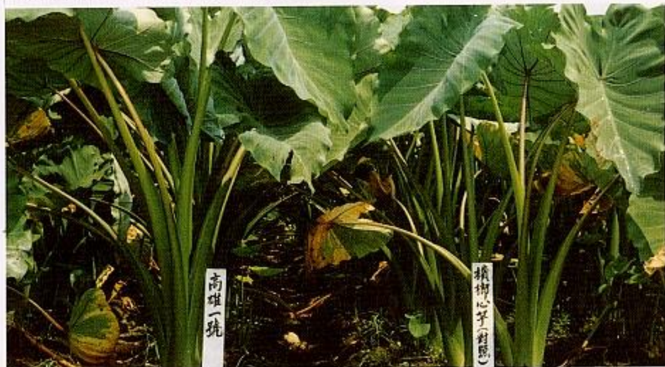
高雄一號(原品系名為高雄選育二種)與檳榔心芋之植株形態

芋好高溫濕潤氣候，生長適溫25~35°C，對土壤適應性強，具耐熱、耐濕、耐旱及耐肥等特性，一般耕地、水田、旱田及山地均可種植。目前本省農民多以水田式栽培「檳榔心芋」品種為主，由於長久採用此一品種的結果，病蟲害日益猖獗，尤其秋作栽植者以地下塊莖感染軟腐病 (soft rot) 最為嚴重，對芋之產量與品質影響頗大。本病原菌棲息土壤內，藉傷口有充分水份時侵入，嚴重時芋頭下端變黑而腐敗。目前除採行輪作方式以減輕本病之發生外，未有適當的防治措施。有鑑於此，高雄區農業改良場旗南分場近年來致力芋品