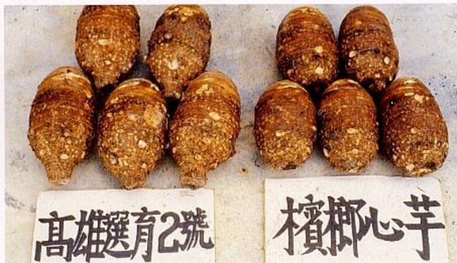
高雄一號(左)與檳榔心芋之母芋性狀