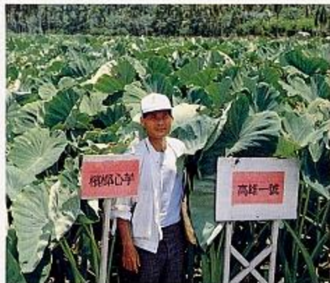
芋新品種「高雄一號」栽培示範