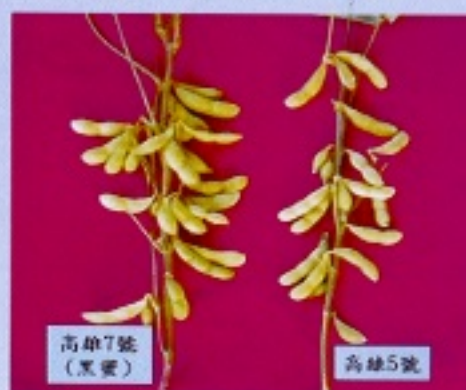
表二 新品種高雄7號與對照品種之單株莢果特性