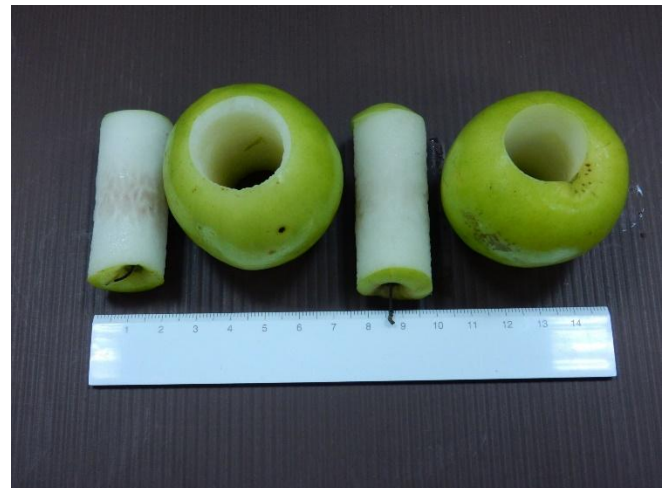
去籽後的棗果與籽