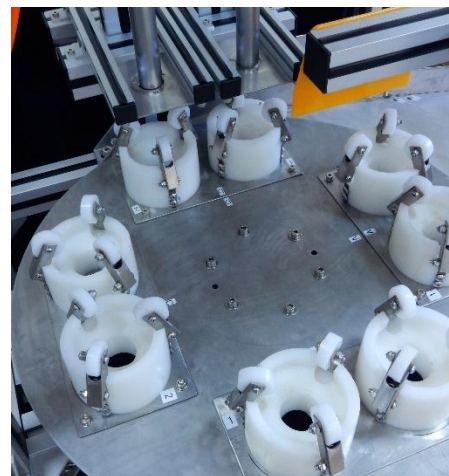
旋轉式棗果固定盤