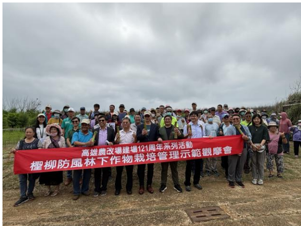
檉柳防風林下作物栽培管理示範觀摩會圓滿成功