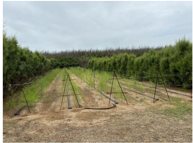
檉柳防風林下的蘆筍，春季刈除枯黃母莖後迅速恢復生產力