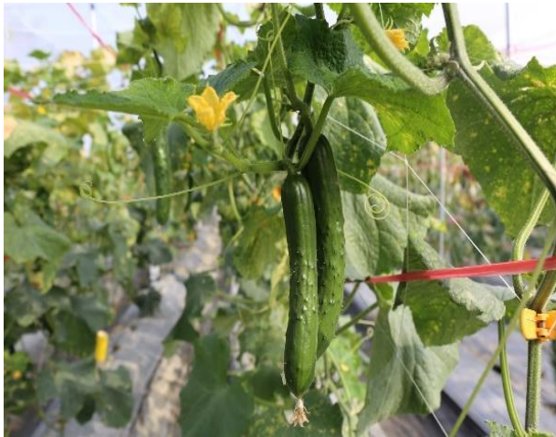
小胡瓜高雄4號-夏植果實長形，果皮較為深綠。