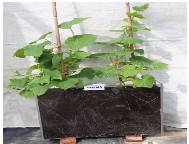
小胡瓜高雄4號-夏植的根系多且分布深綠。