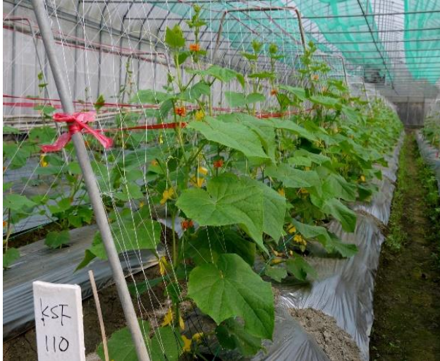
小胡瓜高雄3號-夏青植株開花情形