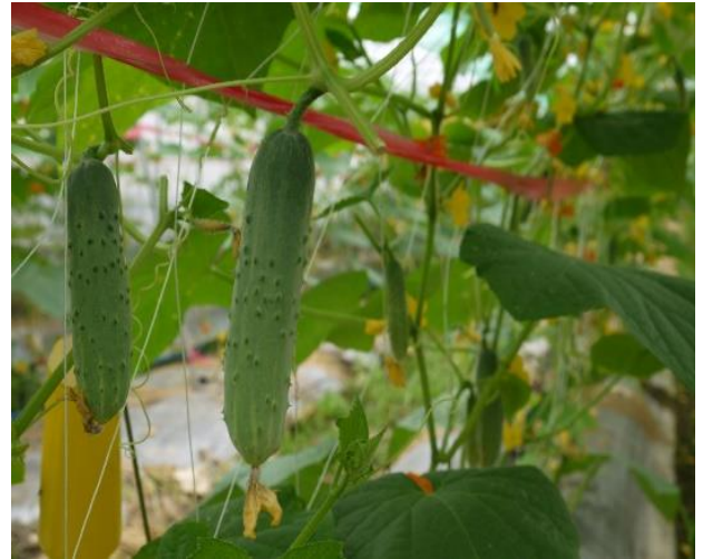
小胡瓜高雄3號-夏青的果形較為短小筆直，果皮為翠綠色。