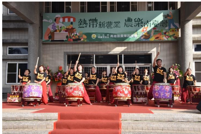
氣勢磅礴的開幕儀式