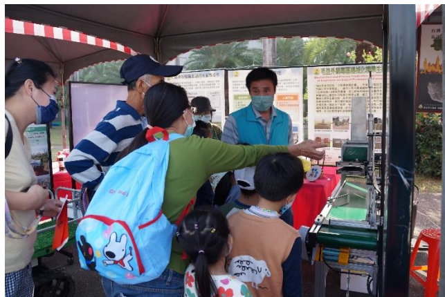
本場研發成果展示區吸引民眾參觀