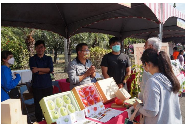
本場技轉廠商展示專區