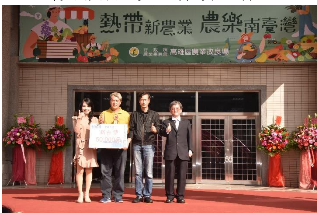
頒發 2023 全國蓮霧優質管理果園評鑑冠軍 得主