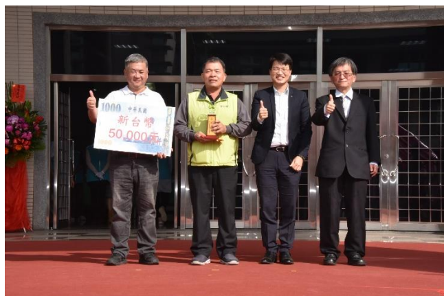
頒發 2023 全國蜜棗優質管理果園評鑑冠軍 得主